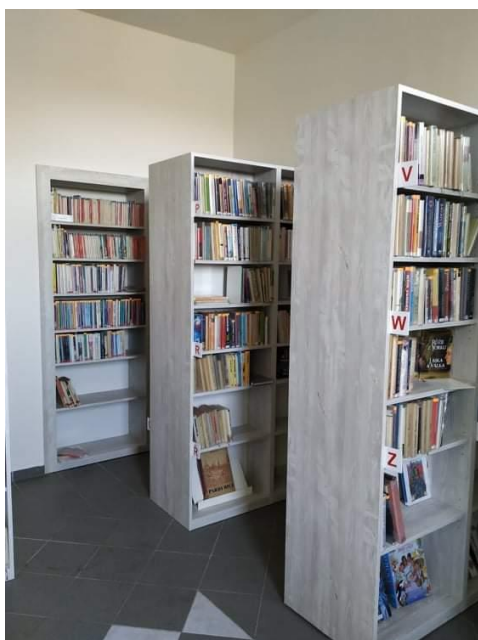
Obecní knihovna v domě Rokytno č.p. 146