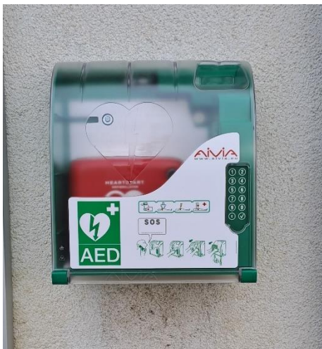
AED v Bohumilči na budově úřadu Bohumileč čp. 44.

V případě náhlé zástavy oběhu je pozastaven přísun okysličené krve k buňkám. Nejcitlivěji reagují na nedostatek kyslíku buňky mozkové, ty již asi po 5 minutách nenávratně odumírají.