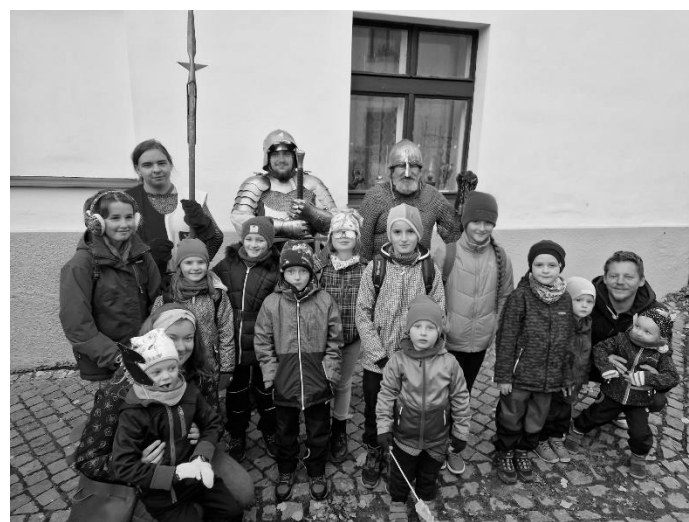
Výlet do Slatiňan